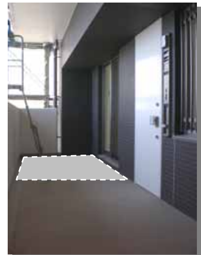
前 広々とした玄関アルコーブ 奥 多目的に使えるパーソナルスペース