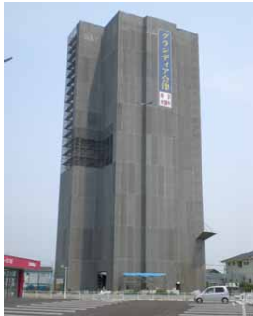
西側外観写真 (H20.5.18 撮影)

JR三津浜駅に隣接した好立地に建設中の「グランディア会津」。8月に完成を控え、現地から少し離れた場所からもその存在感がうかがえるようになりました。三津エリアにお住まいの方やお勤めの方、またJRを利用される方など、一度はその進捗の様子をご覧頂けておりましたら嬉しく存じます。