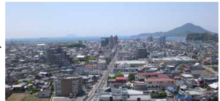
屋上テラスから西側(三津浜港、興居島方面)の実際眺望

南東には松山城やくるりんも見ることができました。もう少し先の話ですが、「完成見学会」では皆様にも実際にご覧頂きたい思います。(エレベーターで・・・)