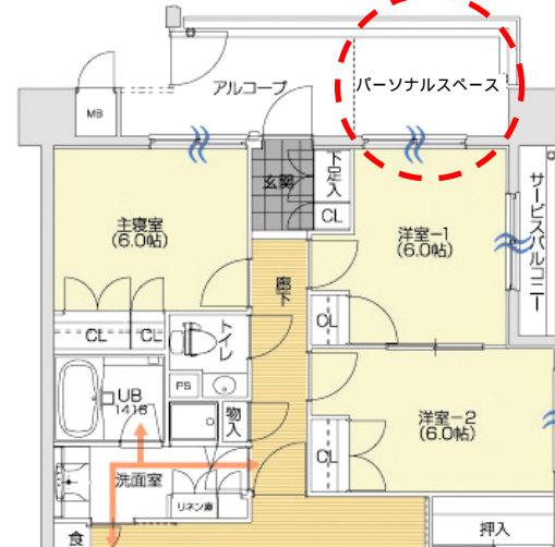
写真はBタイプ3階の現況 (H20.5.18撮影)

グランディア会津の玄関部分には他には無い仕様が特徴的です。従来より高さのある門扉によってプライベート性が確保され、玄関サイドには多目的な用途に利用できるパーソナルスペースを全戸に設けました。私なら、ガーデニングで空間演出を楽しんだり、子供の公園グッズなどを整理するのに便利かなと思います。