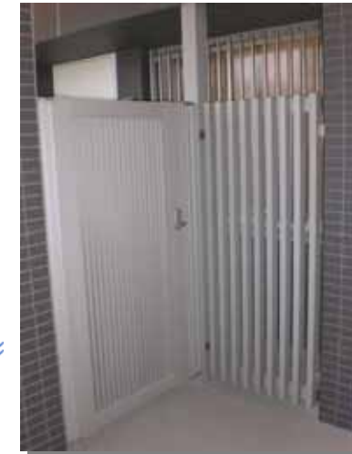
玄関前は専用の門扉によって邸宅感を演出。